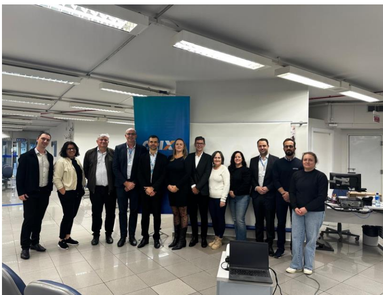
Reunião Caixa Econômica 04.06.2024